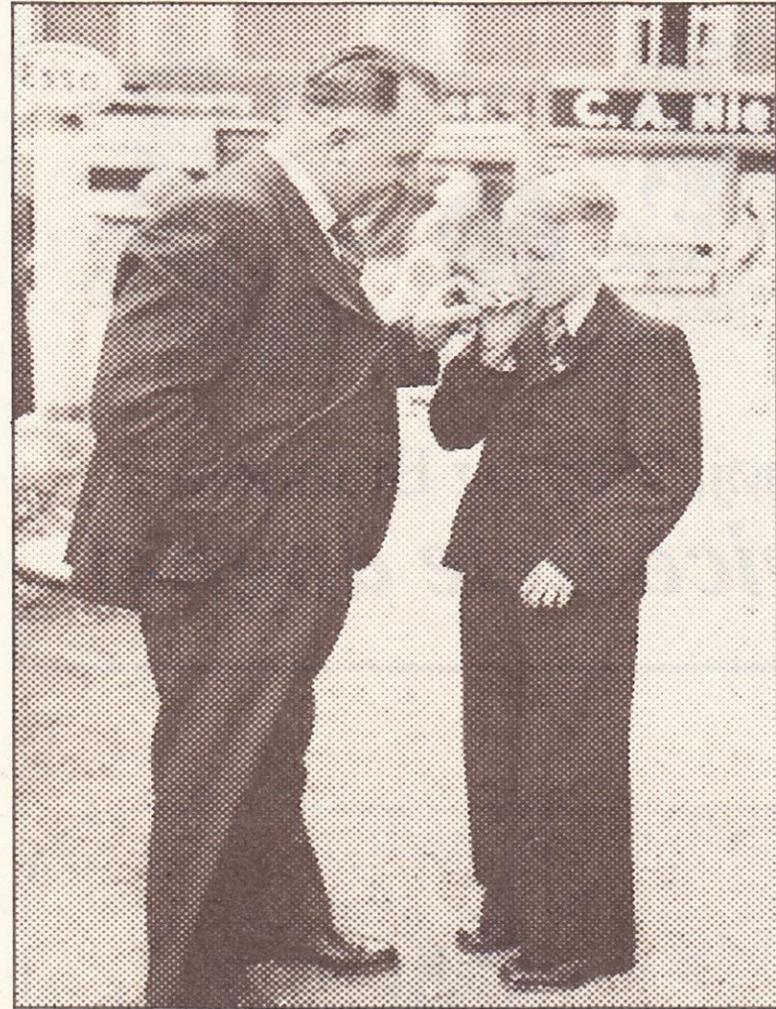
Konfirmation anno 1943. Far tænder cigaren for sin søn.